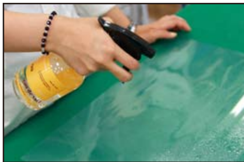
②施工する場所に霧吹きでたっぷり中性洗剤入りの水をかけます。