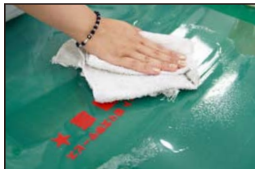
⑧ぞうきんで乾いた中性洗剤をきれいに拭き取ります。