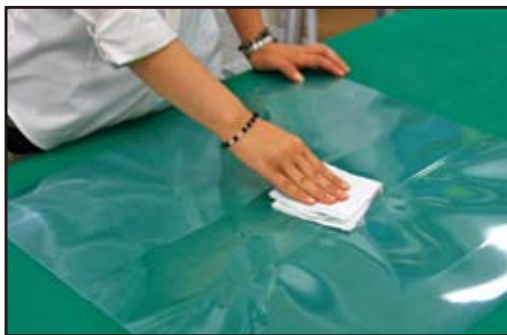
①貼る場所をぞうきんできれいに拭き取ります。