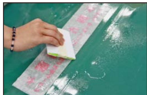
⑥切り文字に水分が完全に無くなるまでよくこすります。