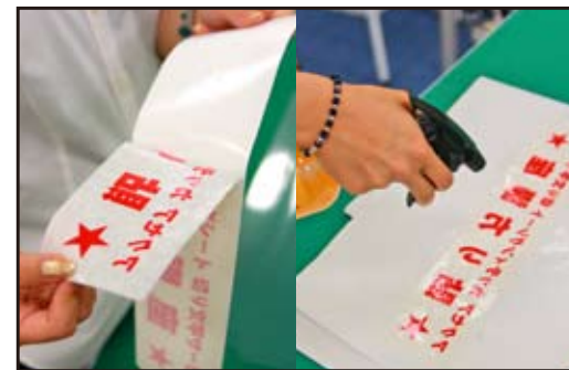
③リタックシートを剥がし、シートの裏面にも霧吹きで濡らします。