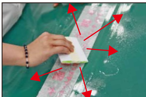
⑤スキージで中心から外に向かって水を押し出すようにこすります。